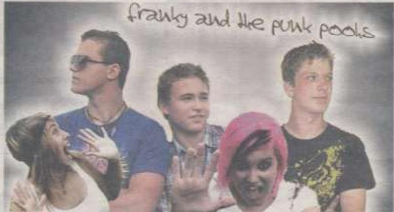
Können auch punkto Optik überzeugen: „Franky and the Punk Poohs“.