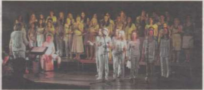
Rund 80 Musikschüler zeigten ihr Können in der Pfarrkirche St. Josef in Rankweil.