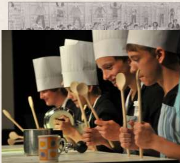
viel mehr angeboten. Außerdem wurden Bilder von der Schule, Zeichnungen und Werkstücke der Kinder ausgestellt.