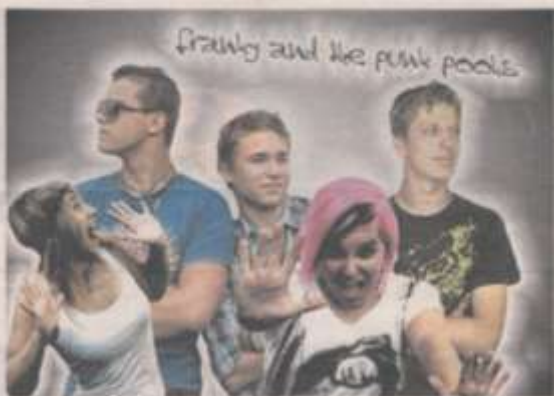
Die Band „Franky and the Punk Pools“ gewann den Wettbewerb.