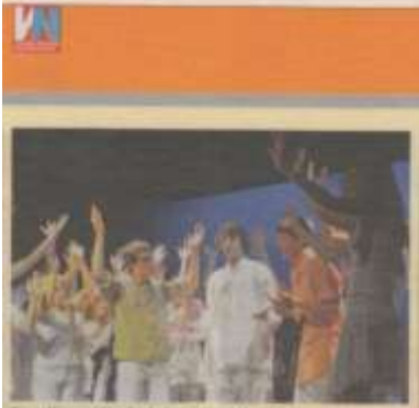
Gospelkonzert Musikschule Rankweil-Vorderland.