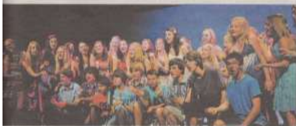
Rankweiler Chöre sind am kommenden Wochenende wieder zu hören.

Der Basilikachor Rankweil gestaltet am Sonntag, 1. Juli 2012 um 9 Uhr das feierliche Amt anlässlich des Patroziniums der Basilika.