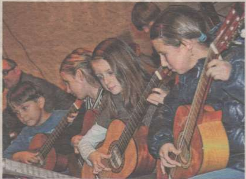
150 Kinder und Jugendliche spielten in der Kirche St. Josef in Rankweil beim Adventkonzert auf.