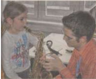
Fachlehrer gaben gerne Auskunft und zeigten die verschiedenen Instrumente.