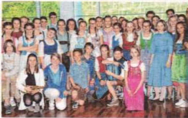
Gäste aus Bozen: Gemeinschaftskonzert der Musikschule Rankweil mit der Partnermusikschule Bozen.

RANKWEIL. (loa) Am Samstag präsentierten sich die Chöre und Instrumentalensembles aus Rankweil und Bozen im Vinomnaaal. Das gemeinsame Konzert mit toller Bühnenperformance, vielen Musikrichtungen sowie bekannten Melodien hat das Publikum begeistert. Den Anfang machte der Kinderchor „Little Voice“ mit „Heute singen wir“. Der Schulchor „Young Voices“ setzte mit „The Lion sleeps tonight“ fort und der Jugendchor „Singing Voices“ gab ein Medley aus Sister Act zum Besten. Neben Posaunen-, Holzbläser- und Hornquartetten bekamen die Zuschauer „Volksweisen“ auf der Steirischen Mundharmonika und „Lolly-