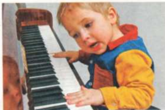
Eltern sollten so oft wie möglich mit ihren Kindern singen.