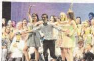
150 Mitwirkende verstanden es, mit „Sing and Dance - Filmhits & Tanzshow“ zu begeistern.