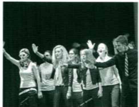
„Sing and Dance“ ist eine Produktion der Musikschule Rankweil-Vorderland, bei der bekannte Filmmelodien gespielt und gesungen werden.