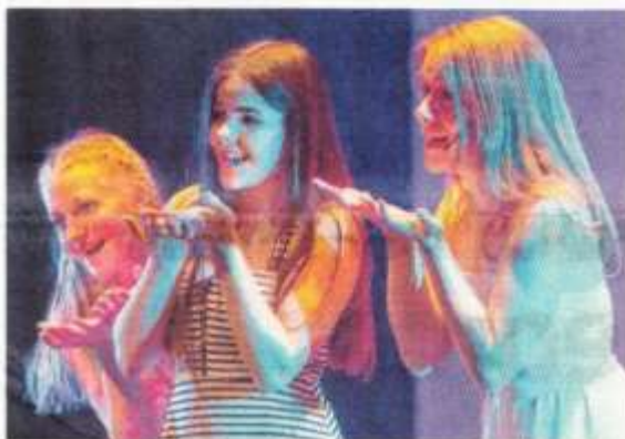
„Mamma mia“, ob Abba-Sound, Shoop-Shoop-Song oder gar der „Fluch der Karibik“: Alles fetzt.

➤ Nächste Schulaufführung am 24. März, 8.30 Uhr, öffentliche Aufführungen am 25., 19.30 Uhr und 26. März, 17.30 Uhr, im Vinomnasaal in Rankweil.