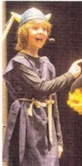
Wickie zeigt, wie rasch diese Show Fahrt aufnimmt.

Als Zuseher, als die wir uns in eine vor den öffentlichen Darbietungen angebotene Schulaufführung schleichen durften, wurden wir jedenfalls in allen drei Punkten gut bedient. Begeisterung hat sich dabei nicht nur ob der Darbietungen von jungen Sängern und Tänzern auf der Bühne eingestellt, sondern auch angesichts der Tatsache, dass die Schüler verschiedenen Alters, die die Publikumsreihen des Vinomnasaals gefüllt hatten, mit großer Konzentration und sichtlichem Spaß dabei