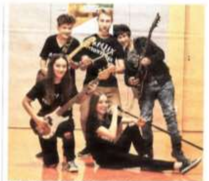
„Frontpage“ – eine Band, die den Nagel trifft – konnte beim Bundeswettbewerb punkten. MUSIKSCHULE RANKWEIL-VORDERLAND

MUSIKSCHULE RANKWEIL- VORDERLAND ne Band, e den Nagel trifft!