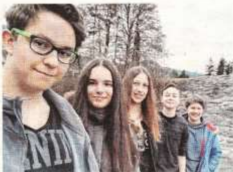
Konzert mit Bands der Musikschule Rankweil-Vorderland.