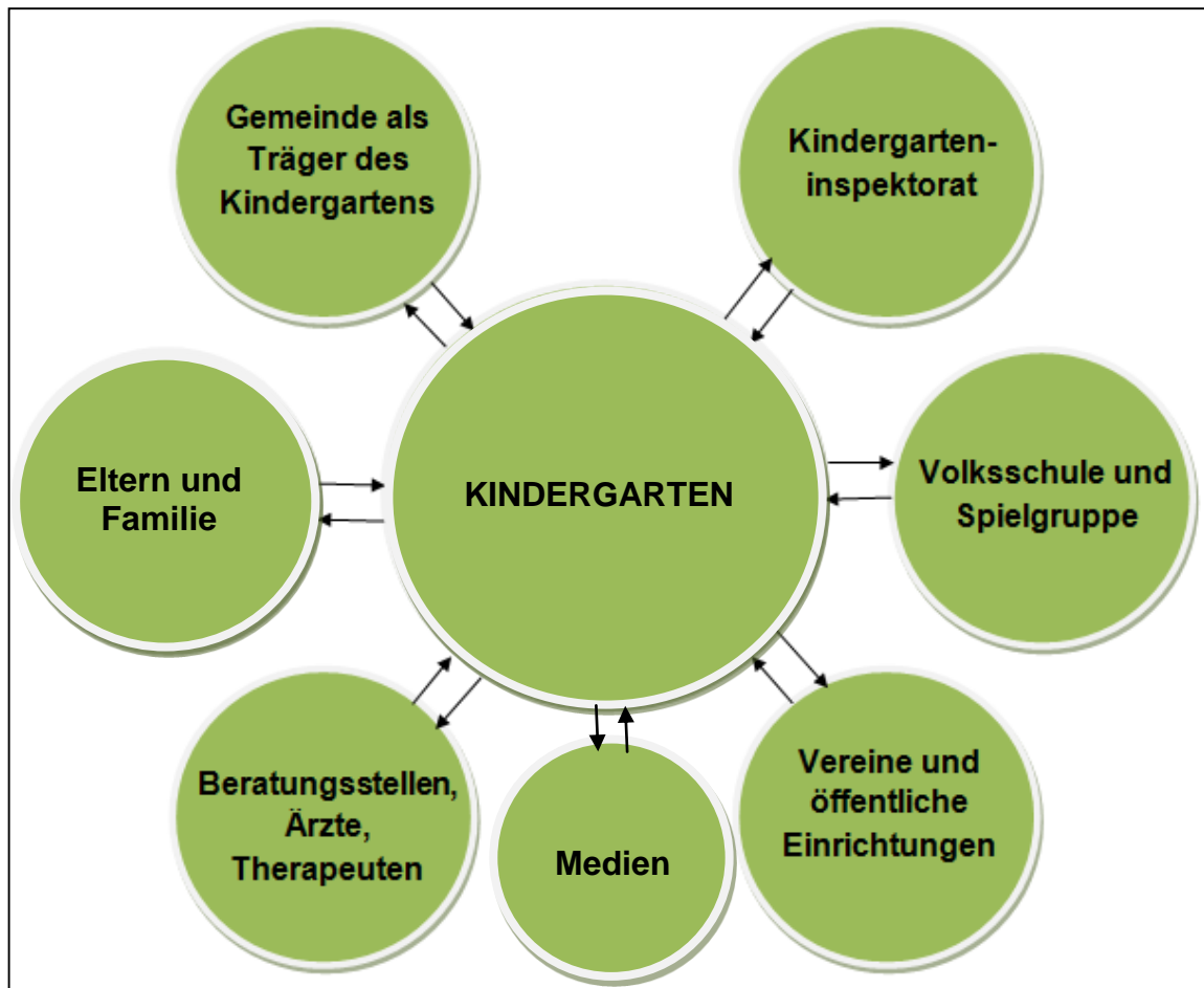
Unser Bild von Öffentlichkeitsarbeit

Nur durch ein verständnisvolles Miteinander aller Beteiligten ist es möglich, die Kinder unseres Kindergartens ein Stück auf ihrem Weg zu begleiten.