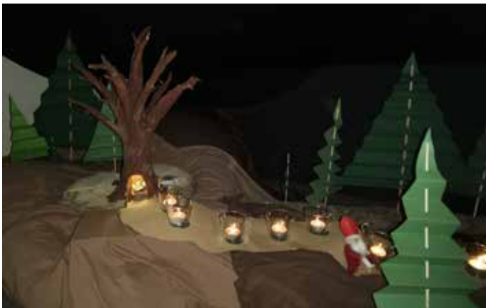
Unser Adventkalender ... ... der Weg durch den Wuselwald zur Krippe.