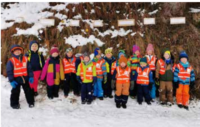
Beim Adventweg der Pfarre waren wir dabei.