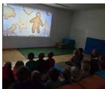
Weihnachtsfeier im Kindergarten mit Kino.