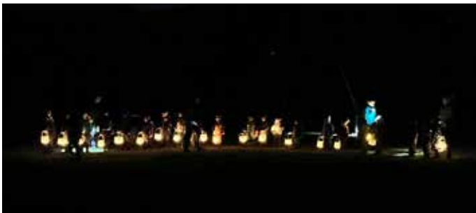
Stimmungsvolles Laternenfest beim Waldplatz.