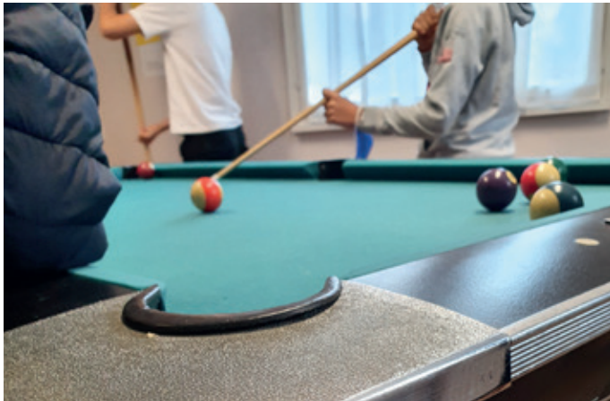
Jugendliche am Billard spielen

Nach einer kurzen Vorstellungsrunde und Führung durch den Jugendtreff, durften die Jugendlichen den Treff voll und ganz für sich in Anspruch nehmen. Es wurde fleißig Tischtennis, Billard und Tischfußball gespielt. Nebenbei gab es in der Küche die Möglichkeit Buttons zu kreieren. Für Verpflegung war auch gesorgt – wir organisierten für die Jugendlichen leckere Butterpfeifen und Schokodrinks.