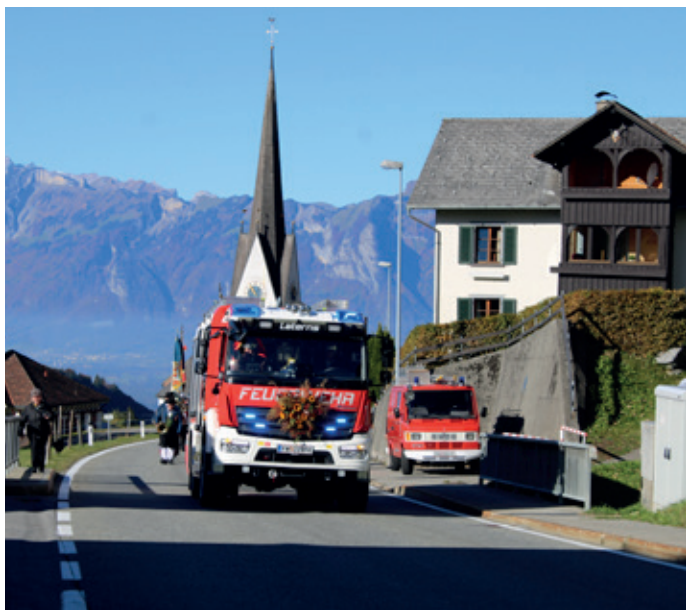
Tanklöschfahrzeug auf dem Weg zur Segnung

Nach dem gemeinsamen Besuch der heiligen Messe in der Pfarrkirche Laterns Thal marschierten die Fahnenabordnungen und Gastfeuerwehren mit den Ortsvereinen zum Dorfsaal.