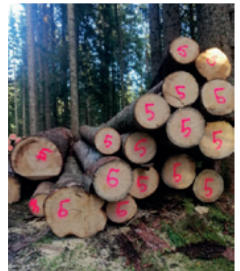
Käferholz vorbereitet zum Verkauf