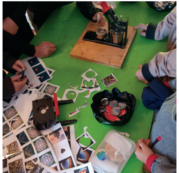
Jugendliche kreieren fleißig ihre eigenen Buttons

Vielen Dank an die Mittelschule Zwischenwasser und allen Schüler*innen die dabei waren – wir hatten einen tollen Vormittag mit euch!