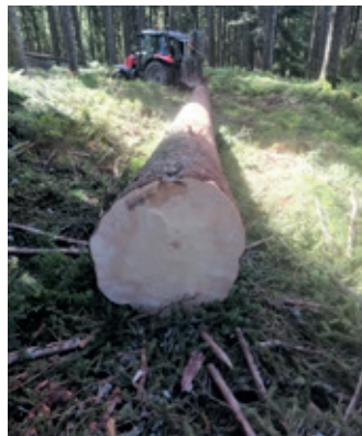
Bonackner Losen: Gemeidetraktor im Einsatz

Das Bauholz (Listenholz) und Schwachholz wurde vom Sägewerk Simon Nesensohn erworben. Weitere Verkäufe erfolgten an die Zimmerei Fetz im Bregenzerwald, Sägewerk Georg Mündle in Satteins, Dobler-Holzbau (Listenholz), sowie Tischlerei Gerold Matt (Starkholz).