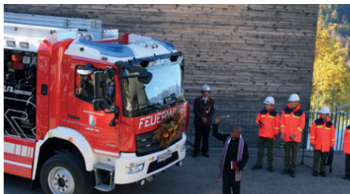
Tanklöschfahrzeug bei der Segnung

Den Segen für das neue Feuerwehrfahrzeug und die damit arbeitenden Einsatzkräfte spendete Pfarrer Placide Ponzo.