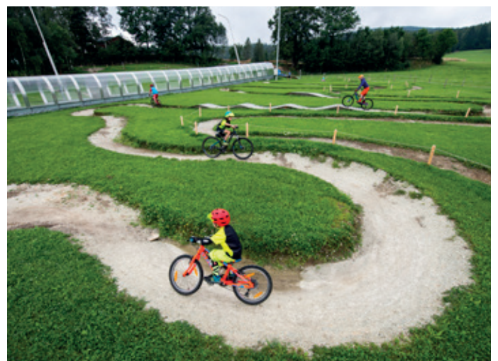
Bürgermeister Gerold Welte