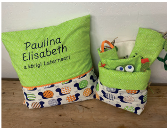
Eines von vielen individuell gestalteten Babypaketen von Isabell Fessler - Herzsclag

Im Jahr 2021 durften wir bereits 10 Geburtsgeschenke von der Gemeinde überreichen. Seit 10 Jahren zaubert uns Isabell Fessler bereits diese wunderschönen und einzigartigen Babypaketete. Unglaubliche 83 Stück hat sie bereits für uns genäht. Wir freuen uns schon darauf, noch viele weitere Geschenke überbringen zu dürfen.