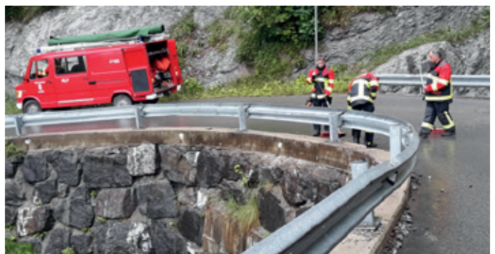
Reinigung und Kontrolle von Straßen und Wegen.