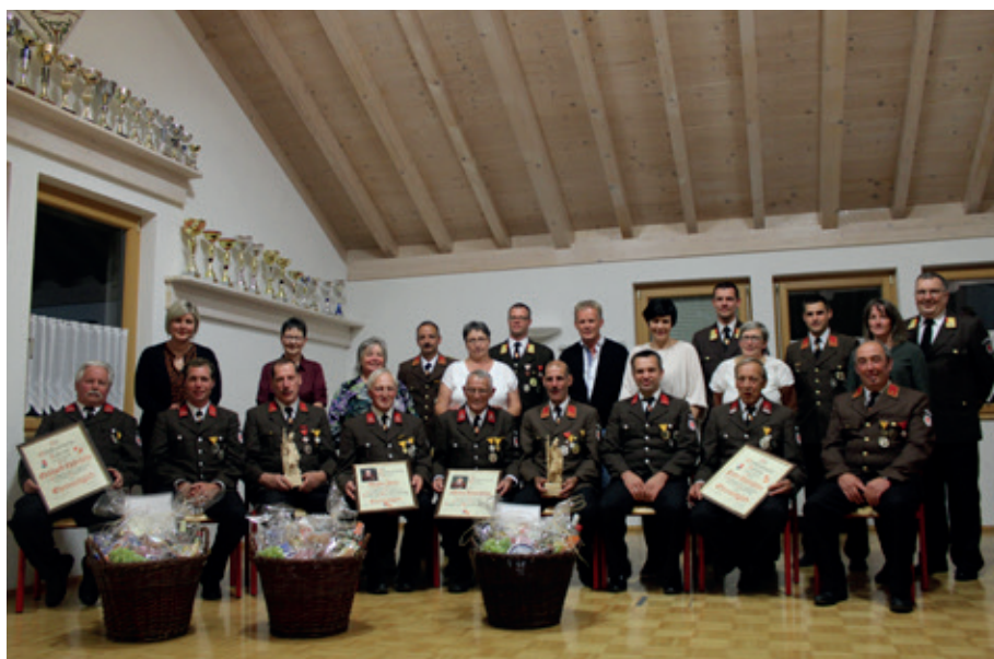
Die Jubilare beim Kameradschaftsabend

Gratulation und ein herzliches Dankeschön allen Jubilaren für ihre langjährige Mitarbeit und ihren Einsatz bei der Feuerwehr.